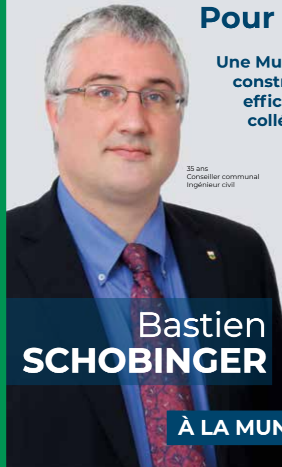
35 ans Conseiller communal Ingénieur civil

Une Municipalité constructive, efficace et collégiale